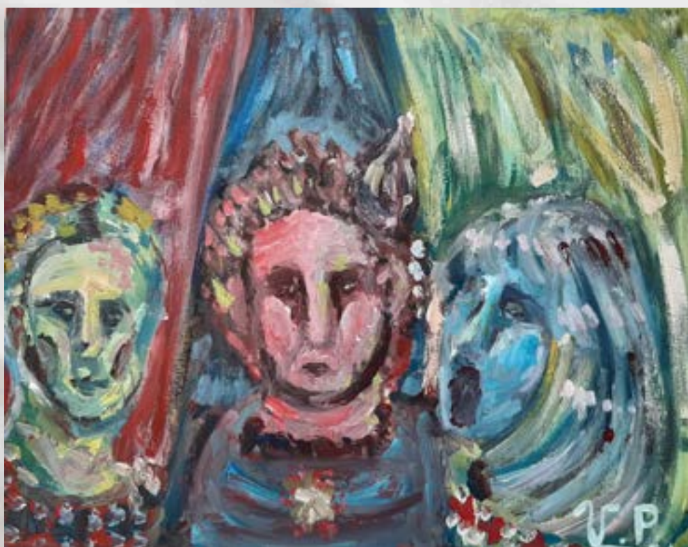
Reinterpretacija Vita Premrl