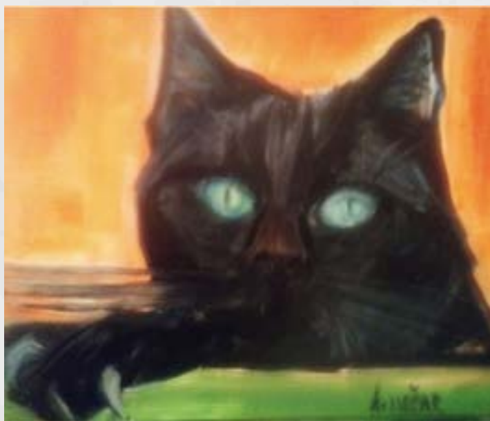
Aprilija Lužar: Moja prijateljica Boni