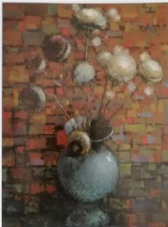
Jože Centa: Bodeča neža