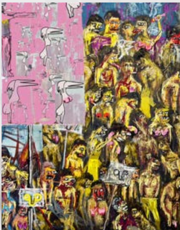
Patrik Dvorščak: The one with the red flag is a lucky guy