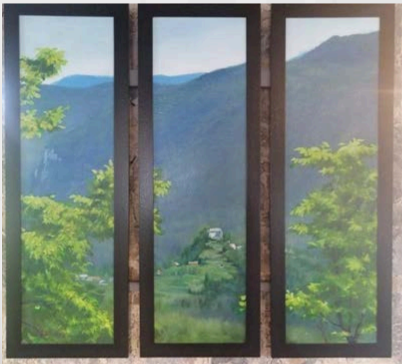
Drago Vidmar: Triptih iz cikla