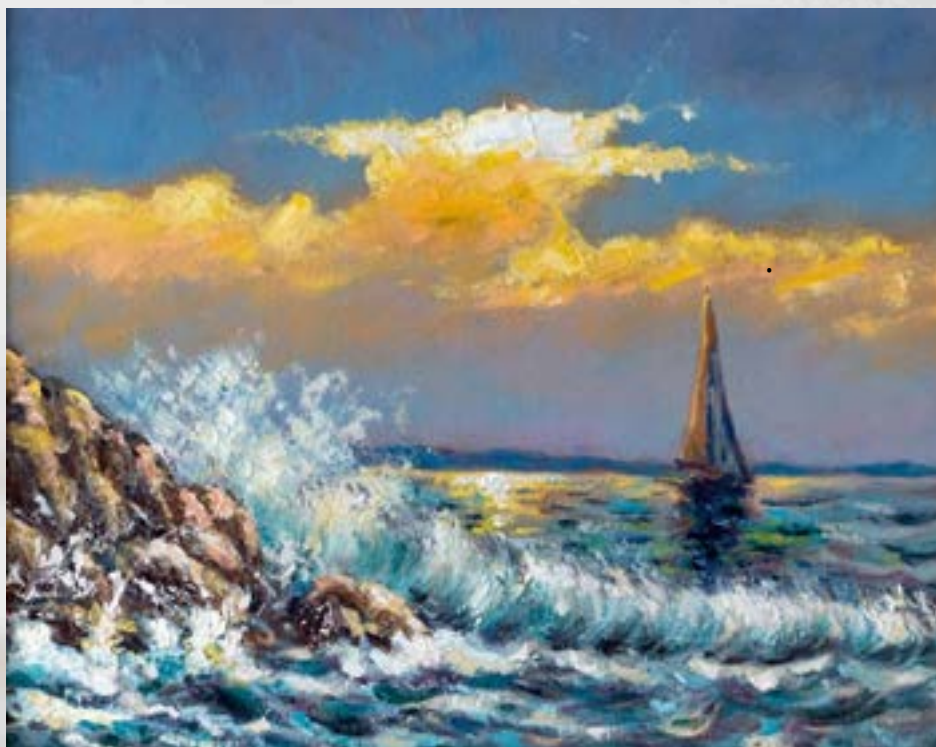
Željko Vertelj: Razburkano morje

5. Željko Vertelj: Ko ti ogledalo nastavi kruta usoda. (2022). Dostopno 25. 10. 2023 na: https://e-utrip.si/zeljko-vertelj-ko-ti-ogledalo-nastavi-kruta-usoda-2/