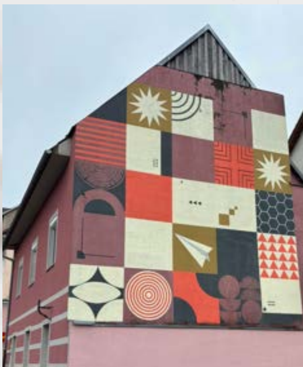
Tomaž Milač: Kočevski mural