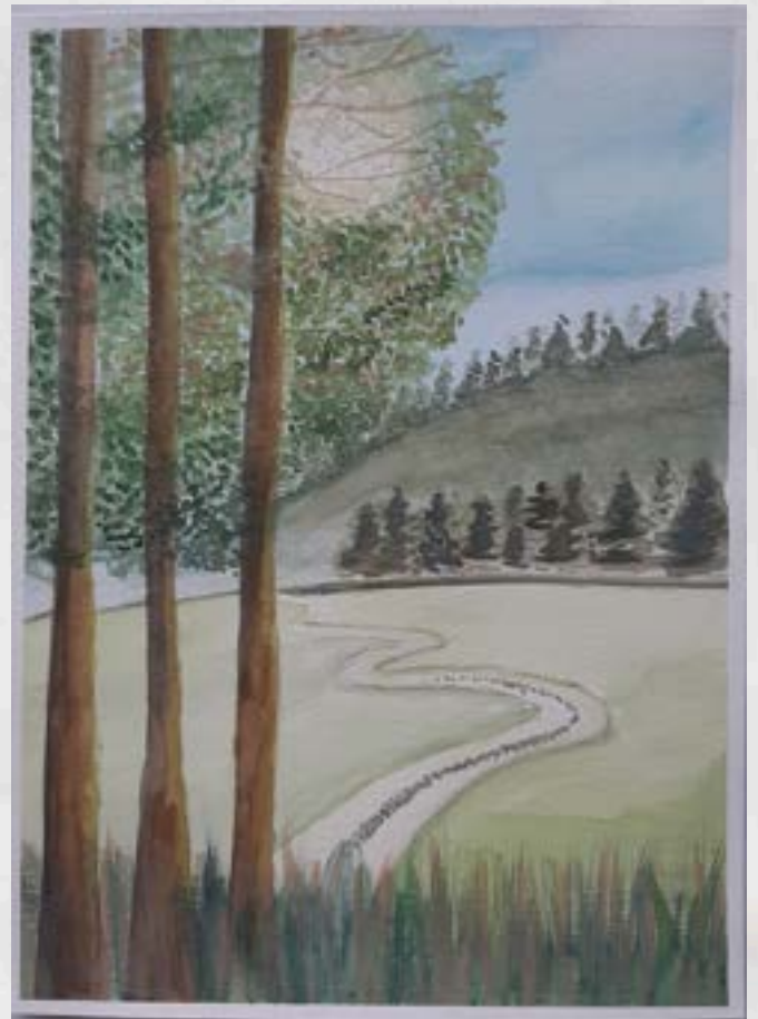
Reinterpretacija Kaja Jerbič