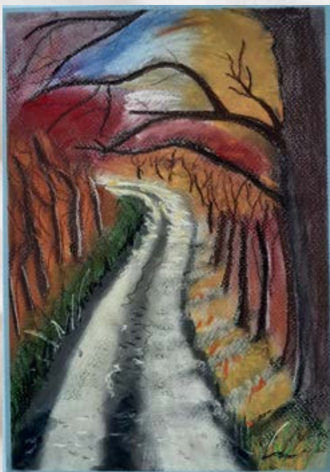
Reinterpretacija Lovro Oražem