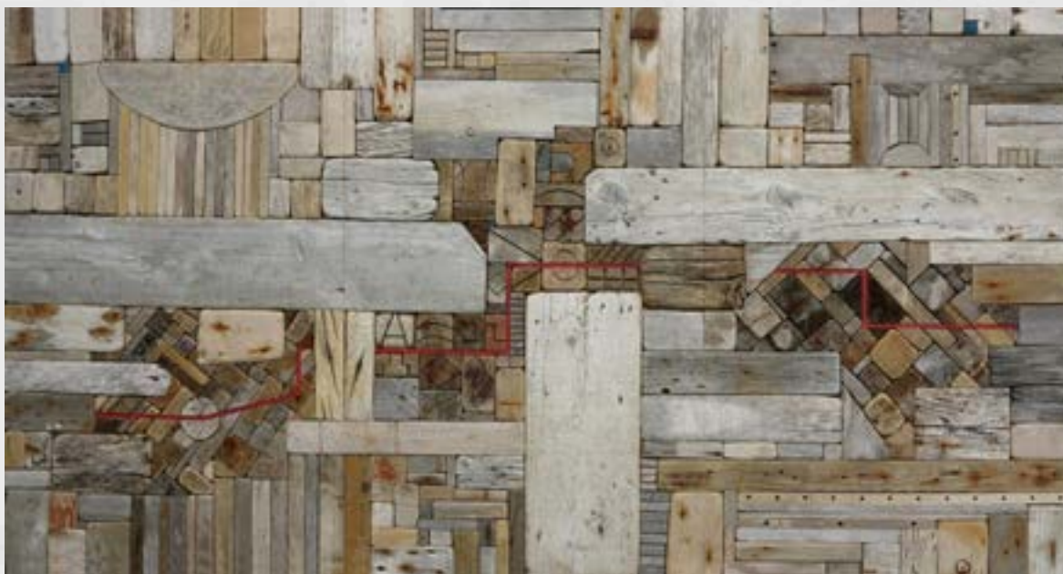
Tomaž Hartman: Tanka rdeča črta Hrani Pokrajinski muzej Kočevje