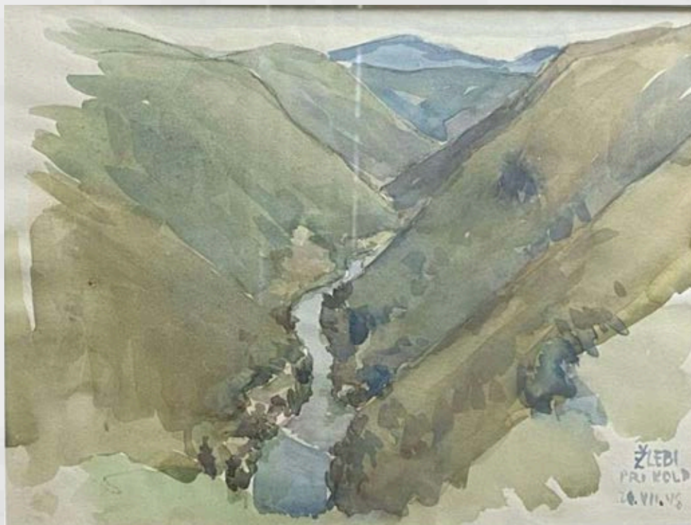
Milan Butina: Žlebe pri Kolpi (FOTO: Lea Rekić) Hrani Pokrajinski muzej Kočevje