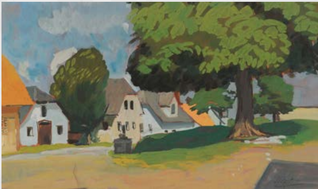
Milan Butina: Morava (Vir: https://www.kamra.si/mm-elementi/milan-butina-morava/ Hrani Pokrajinski muzej Kočevje)