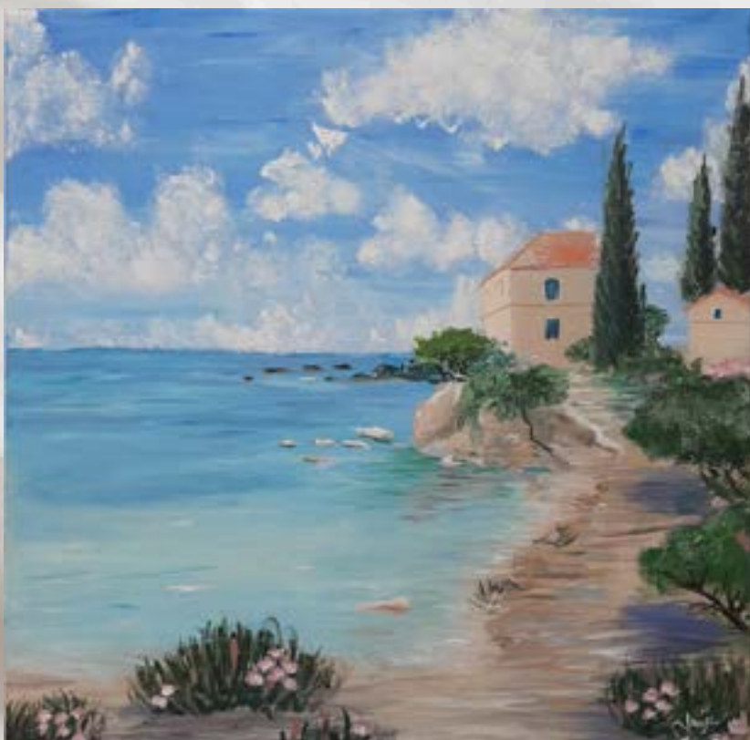
Reinterpretacija Janja Glavonjič